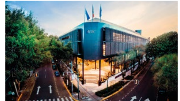
Ciudad de México