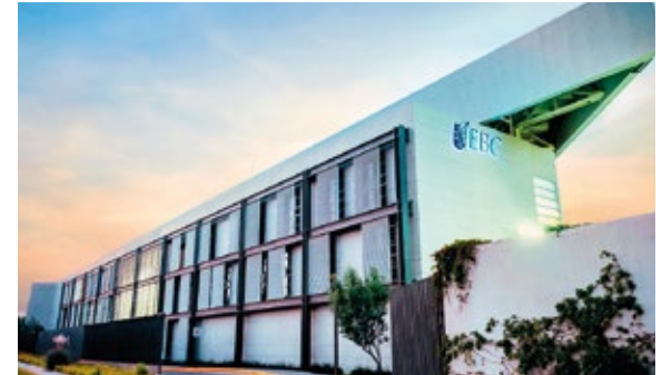
San Luis Potosí