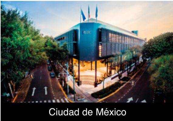
Ciudad de México