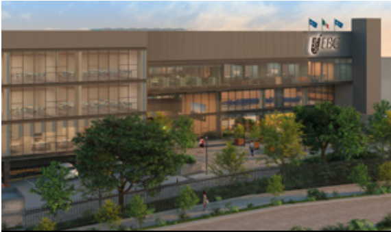
Nuevo Campus CDMX Sur